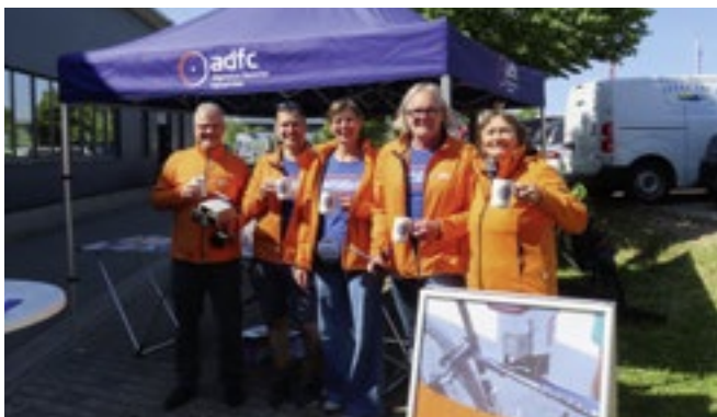
Codierung bei TariBikes, Walldorf