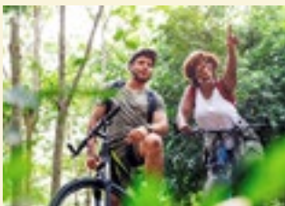
Mit dem Rad im Maudacher Bruch