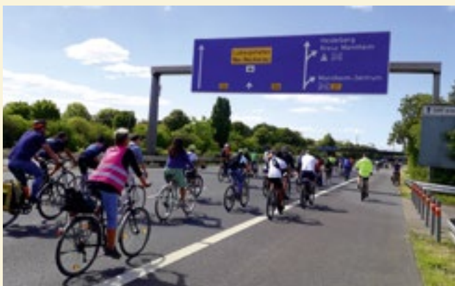
Stadtradeln: Sternfahrt nach Mannheim