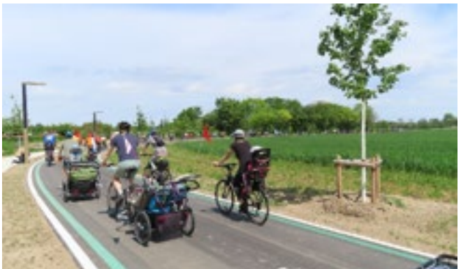
Radschnellweg in Mannheim