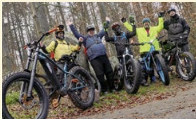
Fatbiker am südlichen Königsstuhl.