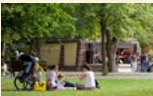
Picknick im Ebertpark